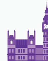
انتخابات سراسری / پارلمانی