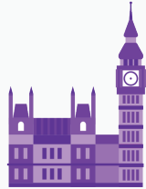
Genel / parlamento seçimleri